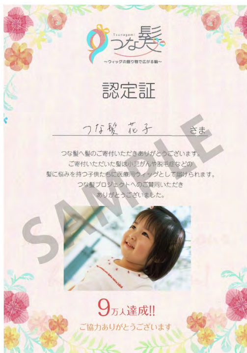
作成イメージ【印刷用 PDF】